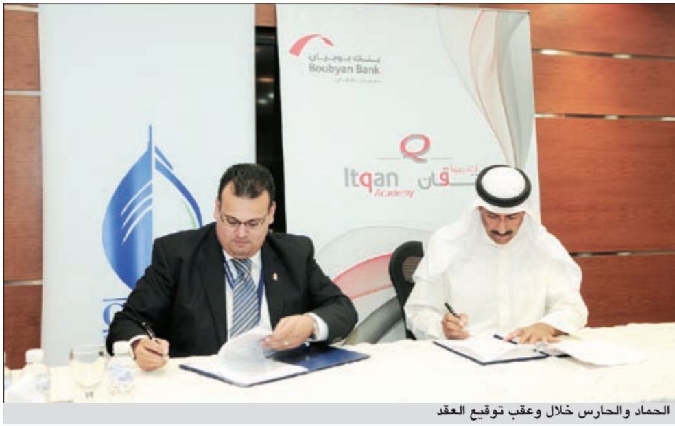
الحمد والحارس خلال وقع توقيع العقد

وتعتبر هذه الاتفاقية الثانية التي يوقعاها البنك مع جامعة GUST حيث سبق ان وقع معها في يونيو الماضي اتفاقية لإنشاء أكاديمية اتقان (التابعة للبنك) لتكون مركزاً لتطوير موارد البنك البشرية بصورة علمية من خلال تقديم أحدث البرامج المتخصصة والعلوم الإدارية والبرامج المعتمدة من جهات علمية والتي تتوافق مع بيئة العمل في البنك ومع الشريعة الإسلامية.