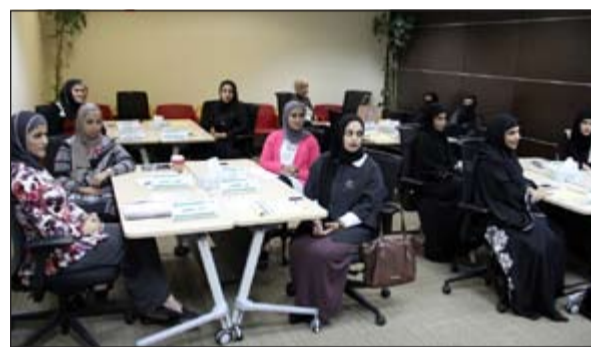
بعض الموظفات المشاركات في البرنامج

نظم بيت التمويل الكويتي (بيتك) برنامجا تدريبيا للدفعة الثانية من الموظفات الجدد - فروع سيدات، استمرارا لنهج «بيتك» في تأهيل ورفع كفاءة كوادره البشرية للإمام الكامل