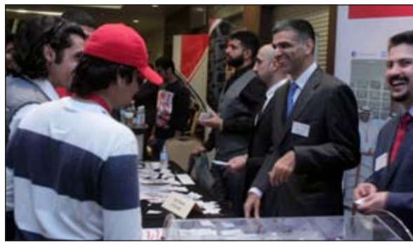
فريق بنك الخليج يتفاعل مع الطلبة في جناحه بالمؤتمر

المؤتمر الذين يكملون سنتهم الجامعية الأخيرة، وأن الطلبة الذين يجتازون بنجاح عملية الاختيار والمقابلات التي أجراها فريق بنك الخليج خلال المؤتمر سيبدأون بالعمل لدى البنك اعتبارا من صيف 2015.